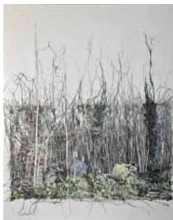
Le grand bois (impression sur tissu rehaussée de broderie machine)

Isabel Bisson-Mauduit pratique la photographie et n'hésite pas à l'imprimer sur des supports divers comme le papier ou de la toile de lin pour venir ensuite les rehausser de fils colorés en broderie machine comme Le grand bois 2014, aux teintes romantiques vertes et marron, allant jusqu'aux limites de la surcharge ou du déchirement, lorsqu'il s'agit du papier, ce qui apporte une profondeur tragique aux sous-bois. Ses affrontements avec une machine à coudre ne l'empêchent pas d'aller dans l'expression la plus simple, mais pas la plus facile.