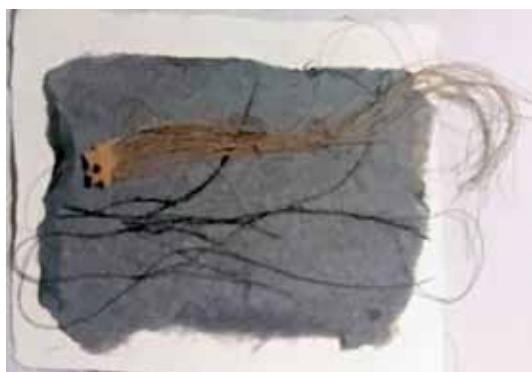
Mots (broderie sur poussière)