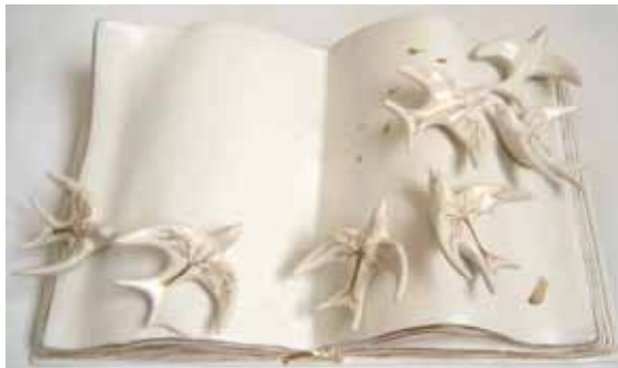
Cache-cache (tapis tufté en laine Ateliers Pinton Felletin) Livre muet (sculpture faïence de Desvres)